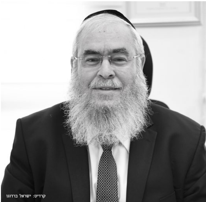
קורט: ישראל ברדוגו

וביאר הח"ח (שמיה"ל פ"י): לכך ביקש יעקב על עוון לשה"ר בפרט, כיון שהוא הלך ללבן, שהוא מקום סכנה, והוא צריך שמירת ה' ית'. ובעוון לשה"ר השכינה מסתלקת. לכך ביקש יעקב 'אם יהיה אלוקים עמדי' - שישמרני שלא אחטא בעוון לשה"ר, ואז אזכה שה' יהיה עמדי ושמרני, ומובטח אני שאשוב בשלום לבית אבי. והנה בגמ' (ב"ק צג.) סבור ר' יוחנן אדם שאומר לחברו הכני פצעני על מנת לפטור פטור. וכן פסק הטור (חו"מ תכ"א).