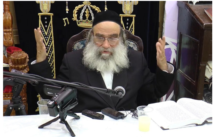
יראתי כי אמרתי פן תגזל (פא 5)

במהלך ההפלגה מיעט העשיר לצאת מתאו המפואר ולהסתובב בין קומות האניה כשאר הנוסעים, כנראה מחשש לעשרו הגדול שנשא עמו... אולם בכל זאת הצליח הגנב לפשפש בתוככי מזוודותיו של העשיר יותר מפעם אחת - אם באישון לילה, בעוד הנגיד נם את שנתו, ואם בעת שעלה אל הסיפון לשאוף מעט אוויר.