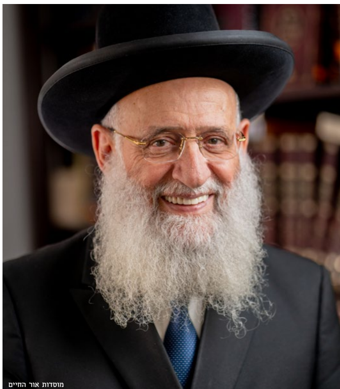
מוסדות אור החיים

יכולה ללבוש חצאית, תחזירו אותי למרוקו, אני לא נשאת פה!". כשראו כי היא עומדת על דעתה, הלכו והביאו לה חצאית. לפני שנפרדנו, אמי אמרה לי: "שמע בני, לך רק למקום שבו שומרים על שבת קודש, לומדים תורה ומתפללים!". ב"רמת הדסה" היו חלוקות השלל, חלוקת השבי והמלקוח. כל הילדים חולקו לכל מיני מוסדות ממגזרים שונים. ישבה שם סוללה של כעשרים אנשים, ביניהם היו גם כן דתיים, ואחד ירא שמים מ"פועלי אגדת ישראל". והם התחילו לחקור כל ילד ולברר האם הוא בן למשפחה שומרת תורה ומצוות.